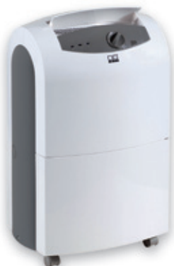
REMKO ETF 320