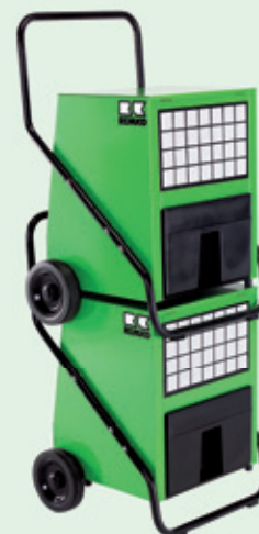
REMKO odvlhčovače jsou stohovatelné

Řada AMT, ETF 400, 550 – provoz již od 3 °C