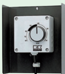
REMKO prostorový hygrometr pro automatické ovládní přístroje

K zabránění škod způsobených vlhkem a k zajištění nepřetržitého postupu prací se doporučuje použít odvlhčovačů.