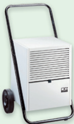
REMKO ETF 400, 550