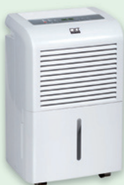
REMKO ETF 360, 460