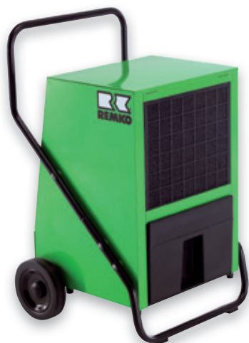
REMKO AMT 85-E

Serie AMT, ETF, ASF vysouší a odvlhčují spolehlivěji než slunce a vítr