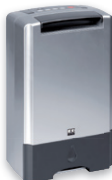
REMKO ASF 100